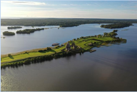
Вид на остров Кижича от въздуха

Ако има място в Русия, което изглежда като излязло от приказките, то определено се намира на остров Кижича. Тук, заобиколен от невероятната и сурова природа на Карелия, има уникален паметник на дървената архитектура - архитектурният ансамбъл на Кижича Погост и единствен по рода си музей-резерват.