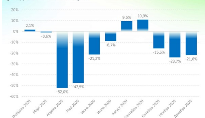
Динамика расходов на внутренний туризм, отклонение от трендового значения, %

В отсутствие возможности поехать за рубеж многие туристы переключились на внутренние направления. В период летних отпусков такая смена предпочтений привела к росту расходов россиян на поездки по регионам страны, несмотря на существенные потери во время весенней волны коронавируса: в августе и сентябре превышение трат над трендовым значением составило 9,5% и 10,9% соответственно. При этом в зимний период, из-за наступления второй волны пандемии, расходы туристов вновь продемонстрировали значимое снижение.